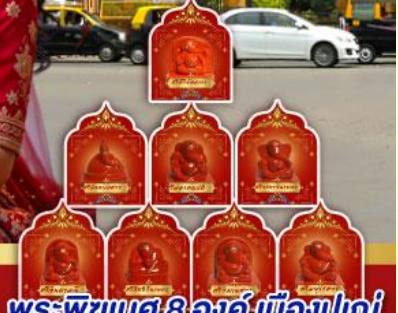
พระพิฆเนศ 8 องค์ เมืองปูเณ