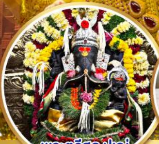
พระศรีศูล ปูเณ (Trishul Pune)