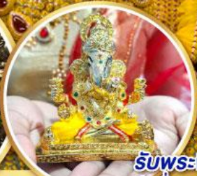
รับพระพิฆเนศวร ปางรำรอย ท่านละ 1 องค์