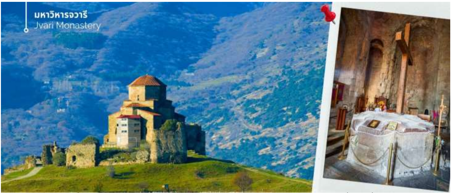
มหาวิหารจวารี Jvari Monastery

จากนั้นอิสระ ถนนคนเดินชาเดอณี (Jan Shardeni Street) เป็นถนนคนเดินสายสั้นๆ ที่ตั้งอยู่ใจกลางย่านเมืองเก่า (Old Tbilisi) ของเมืองหลวงทบิลีซี ประเทศจอร์เจีย ถนนสายนี้ได้รับการยกย่องว่าเป็นหนึ่งในศูนย์รวมทางสังคม ไลฟ์สไตล์ และวัฒนธรรมที่คึกคักที่สุด โดยผสมผสานสถาปัตยกรรมแบบคลาสสิกดั้งเดิมเข้ากับกลิ่นอายความโรแมนติกแบบยุโรป ย่านนี้เต็มไปด้วยอาคารเก่าแก่สไตล์วินเทจ คาเฟ่ริมทาง บาร์ไวน์ และแกลเลอรีศิลปะเก๋ๆ แหล่งแฮงก์เอาต์ยามค่ำ คินสวอร์คของคนรักอาหารท้องถิ่นและเลือกซื้อของที่ระลึกที่นั่นได้