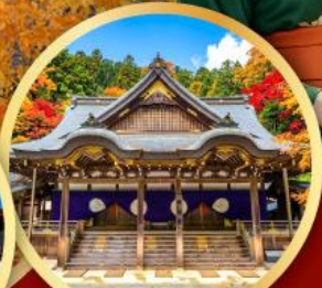
ศาลเจ้าอิสะ