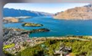
นั่ง Skyline สู๋ Bob's Peak