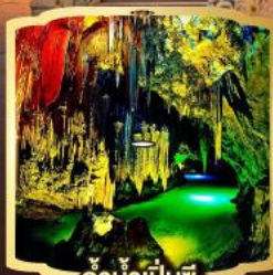
ถ้ำน้ำเป็นซี