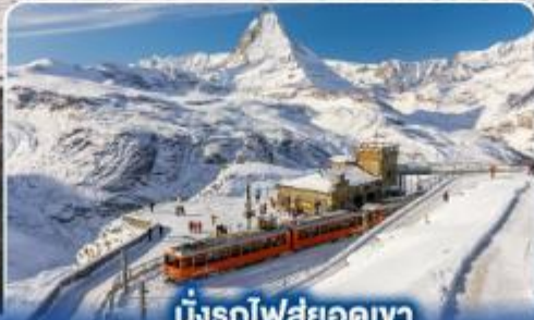
นั่งรถไฟสุดอลเวง กรอนเนอร์เกรต