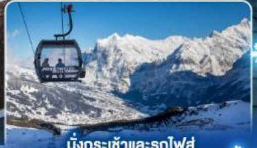
นั่งกระเช้าและรถไฟสุด อลเวงจากจุงเฟรา