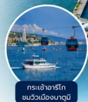
กระเช้าอาร์โก ชมวิวเมืองบาตูมิ