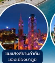
ชมแสงสียามค่ำคืนของเมืองบาตูมิ