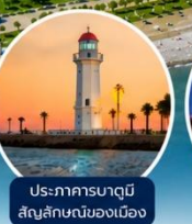
ประภาคารบาตูมิ สัญลักษณ์ของเมือง