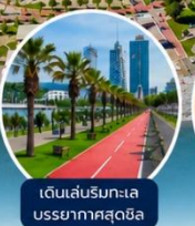
เดินเล่นริมทะเลบรรยากาศสุดชิล