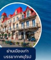
ย่านเมืองเก่าบรรยากาศยุโรป

☁️ การล่องเรือขึ้นอยู่กับสภาพอากาศ กรณีที่ไม่สามารถล่องเรือได้ ทางบริษัทขอสงวนสิทธิ์ปรับเปลี่ยนโปรแกรมตามความเหมาะสม