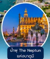
น้ำพุ The Neptun แห่งบาตูมิ