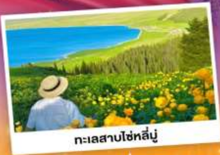
ทะเลสาบไซหลู่

ถ่ายรูปทุ่งดอกลาเวนเดอร์ - กุ่่งหญ่้าคาลาจุ่น SKY GRASSLAND กุ่่งหญ่้ามรดกโลก