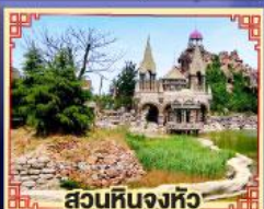
สวนหินจิ้งหัว