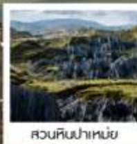
สวนหินป่าเหมย