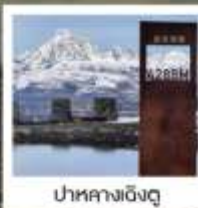
ป่ากลางเฉิงตู