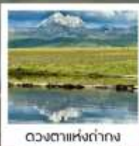
ดวงดาวหิ่งถ่าง