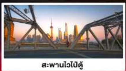
สะพานไวป่ตุ