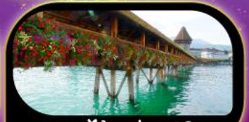
สะพานไม้ชาเปล คูซีน